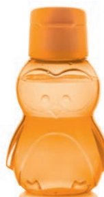
EcoEasy Pinguin Inhalt: 350 ml C 170 € 9,50 ★10