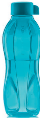
EcoEasy 750 ml C 178 € 13,00 ★13

Die Produktion von Einweg-Wasserflaschen verbraucht 2000-mal mehr Energie als die Bereitstellung von Trinkwasser aus dem Hahn. Entscheide dich für Mehrwegflaschen, füll sie zu Hause ab und spare Schluck für Schluck Energie.*