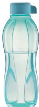
EcoEasy 500 ml C 136 € 11,00 ★11