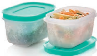
Eis-Kristall 170 ml (2) G 41 € 11,50 ★12