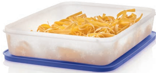
Eis-Kristall 2,25 l G 38 € 23,00 ★23