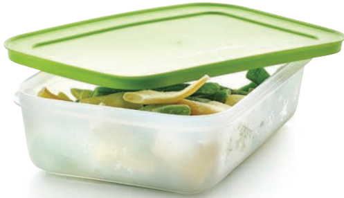
Eis-Kristall 1,0 l G 36 € 13,00 ★13

Vorkochen, einfrieren und frisch genießen, wann immer Kochen gerade mal nicht in den Zeitplan passt.