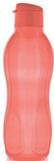
EcoEasy Trinkflasche 1,0 l C 138 € 16,00 ★16