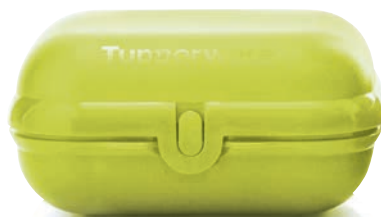
Eco+ Twin-Set (2)

2 praktische Größen, ineinander verstaubar. 14 x 11,2 x 6,5 cm und 13 x 10 x 5 cm