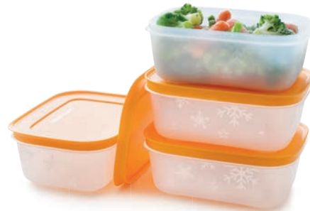
Eis-Kristall 450 ml (4) G 34 € 22,50 ★23