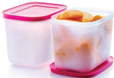
Eis-Kristall 1,1 l hoch (2) G 35 € 17,00 ★17

Perfekt passend zu den Silikonbackformen auf Seite 63.