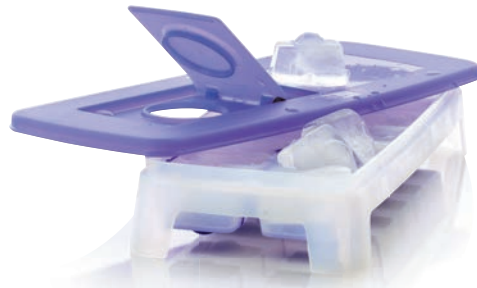
Eiswürfler Einfaches Befüllen und leichtes Herausdrücken einzelner Eiswürfel dank des flexiblen Bodens. G 29 € 18,00 ★18