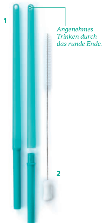
1. Eco+ Straw (2)

Wenn 2 Millionen Menschen einmal pro Woche einen Mehrwegbecher benutzen, erspart das der Umwelt jährlich 104 Millionen Einwegbecher, die im Müll landen.*