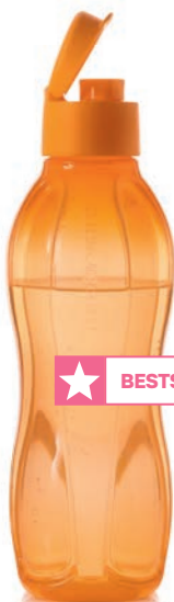
EcoEasy Trinkflasche 750 ml C 139 € 14,00 ★14