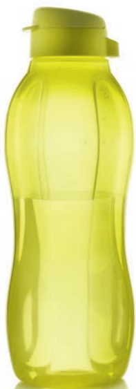
EcoEasy Trinkflasche 1,5 l C 183 € 19,00 ★19