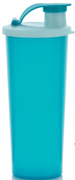
Eco+ Trinkbecher 470 ml