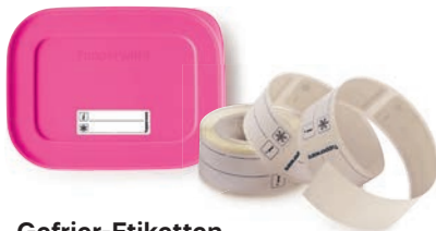
Gefrier-Etiketten 100 Etiketten zum Notieren von Datum und Inhalt. Je 5,1 x 1,7 cm E 33 € 3,50 ★4 2