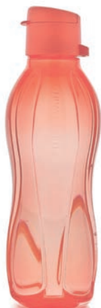
EcoEasy Trinkflasche 500 ml C 179 € 12,00 ★12